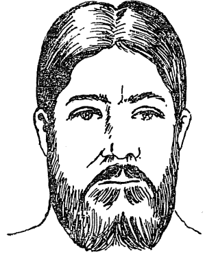
Şekil - 3